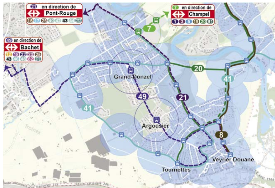
Tracé des lignes existantes : 8, 20 et 41 et futures : 7, 21 et 49 Rayon de desserte de 300 mètres par rapport aux arrêts.

Cela étant, le Conseil administratif a souhaité privilégier le passage de la ligne 49 par le village au lieu d'un rabattement direct sur le terminus des Tournettes depuis le giratoire Uche/Rasses. Ce parcours offre ainsi une connexion directe entre le village et le centre sportif du Grand-Donzel tout en ne présentant aucun coût supplémentaire puisqu'il utilise les infrastructures existantes de la ligne 41. Il dessert ainsi les écoles de la Salésienne, du Grand-Salève et la crèche des Etournelles. Les TPG et l'OCT ont validé cette alternative malgré le rallongement de la ligne.