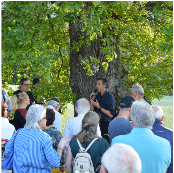
Visite du site lors du premier atelier.

Il n'est pas nécessaire d'avoir participé au premier atelier pour venir. Un résumé des discussions sera transmis.