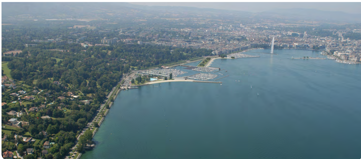
LA FUTURE PLAGE PUBLIQUE DES EAUX-VIVES – Vue du ciel

Nombre d'entreprises et bureaux chantier 10