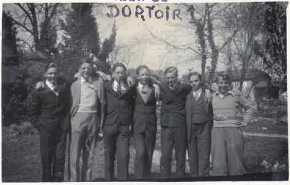
CEUX DU DORTOIR