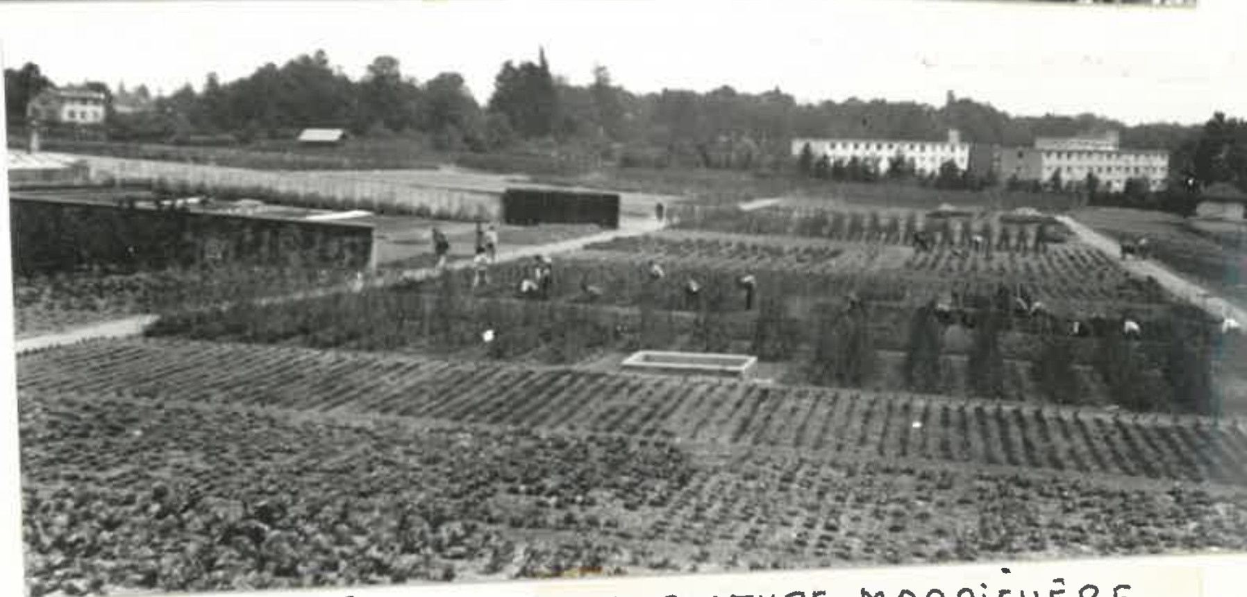
3 PHOTOS DE LA CULTURE MARAÎCHÈRE