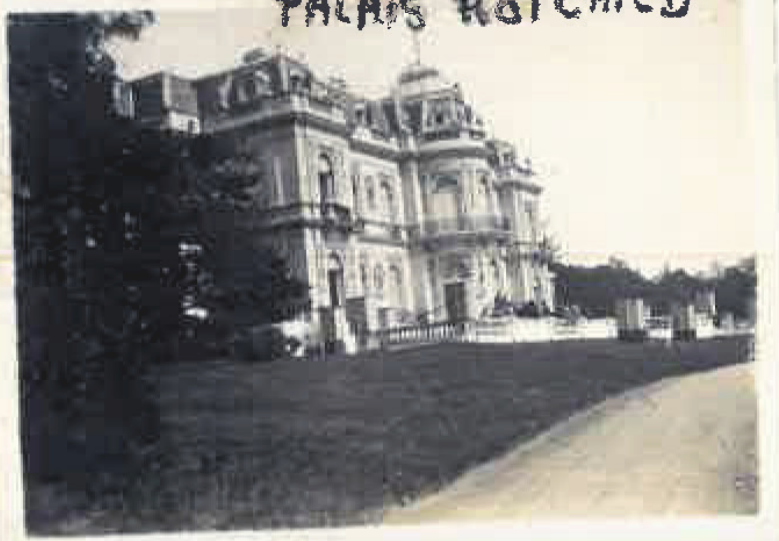
VISITE DE LA PROPRIÉTÉ