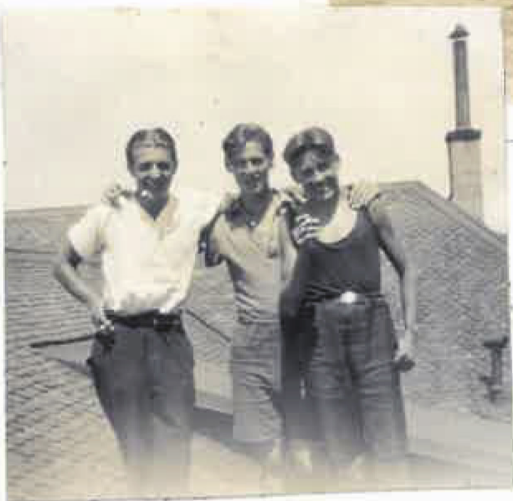
SUR LE TOIT. DÉFENDU.. O CONDUITE