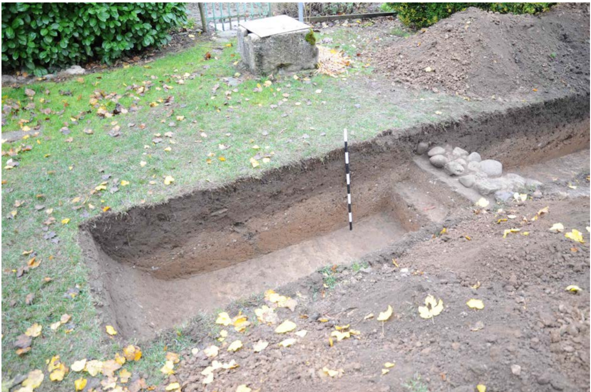
Fig. 5 Sondage 3 (D. Genequand).