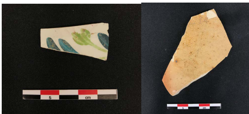
Fig.2 Fragment de panse de faïence peinte et de bouteille d'eau minérale en grès.