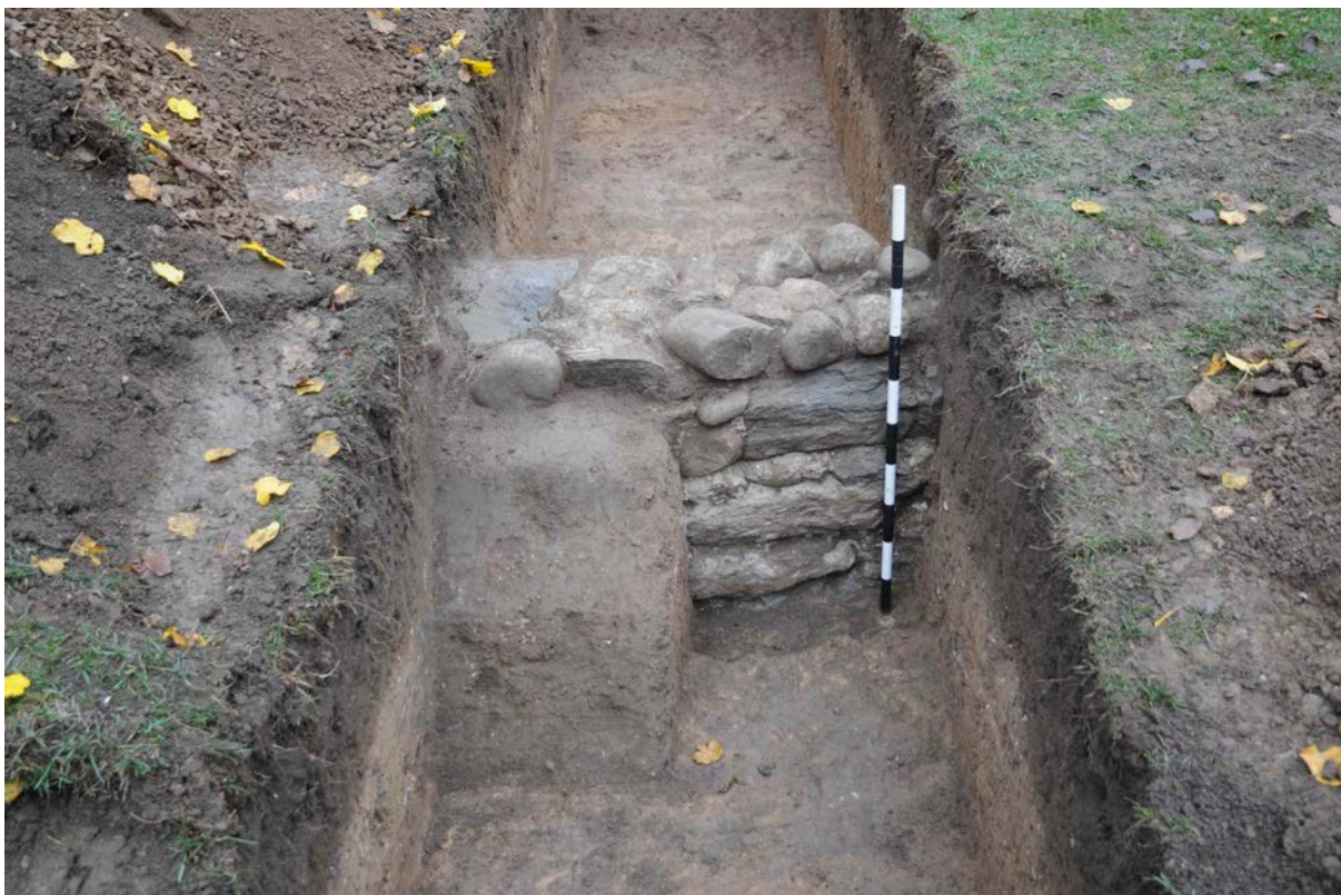
Fig. 6 Fondation de mur de clôture moderne dans le sondage 3 (D. Genequand).