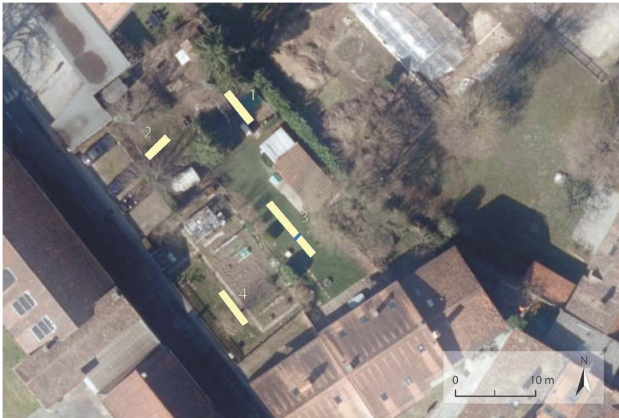
Fig. 2 Plan des sondages sur orthophotographie aérienne (G. Consagra).