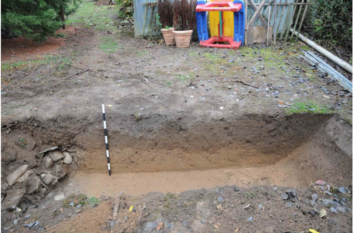
Fig. 4 Sondage 2 (D. Genequand).