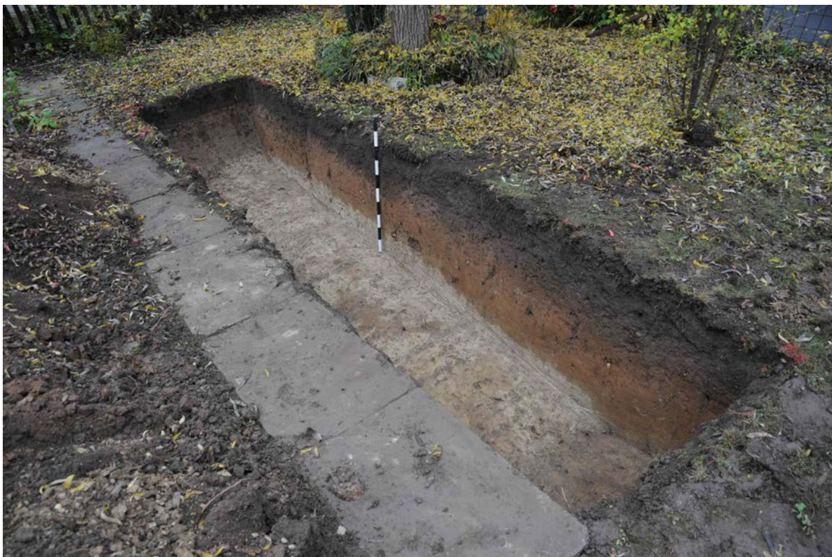
Fig. 7 Sondage 4 (D. Genequand).