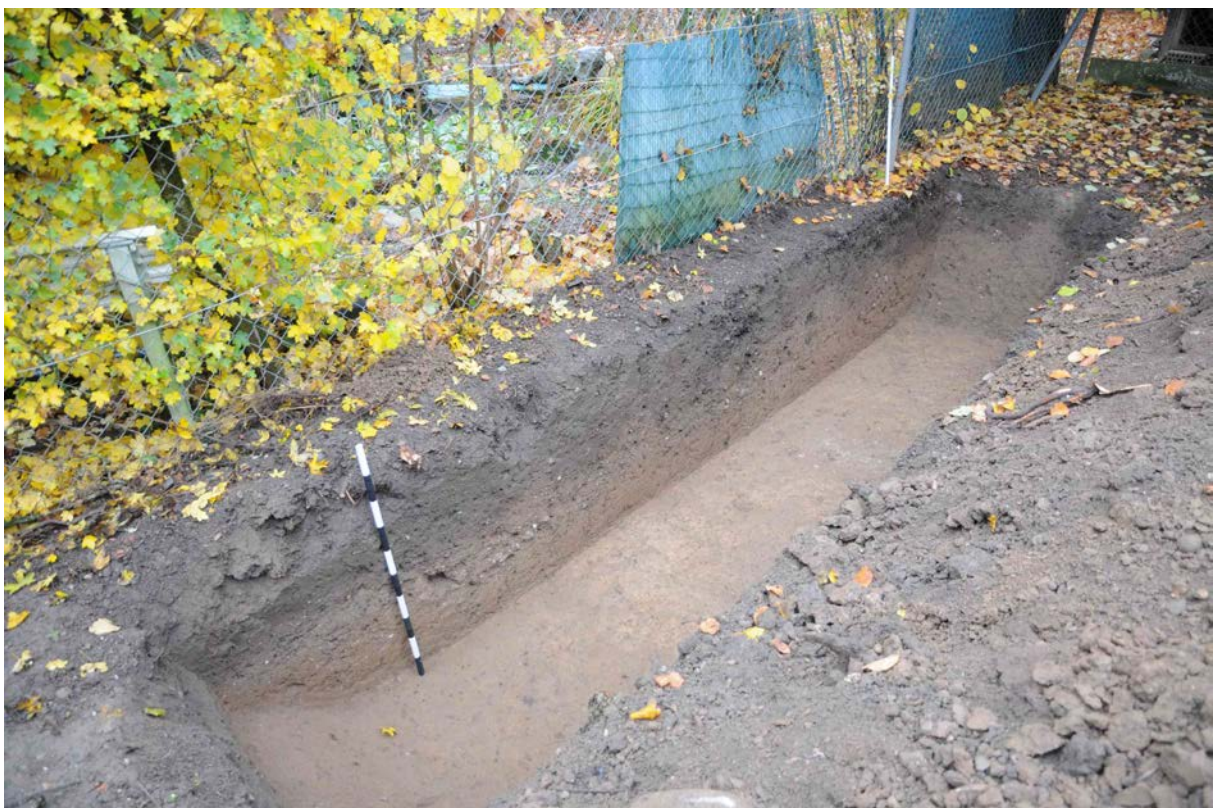
Fig. 3 Sondage 1 (D. Genequand).