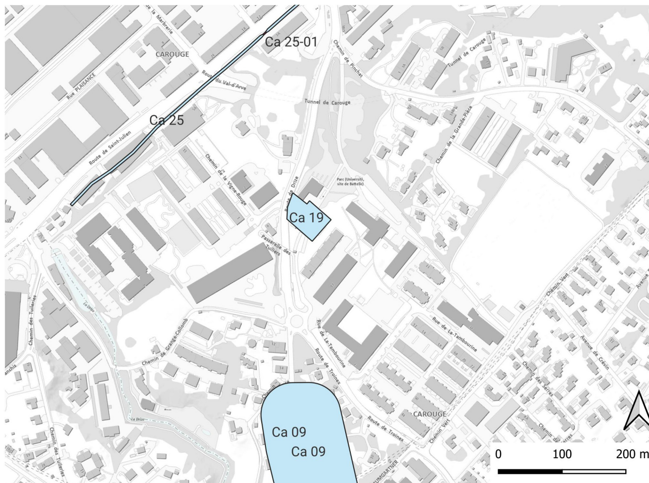
Figure 3. Extrait de carte archéologique et emplacement des mentions archéologiques environnantes