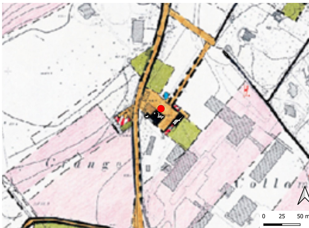
Figure 4. Extrait du cadastre napoléonien sur lequel est représenté le petit hameau de bâtiment de ferme, d'une cour et de bassin. En noir sont figurés les bâtiments encore présents dans les années 1980. Le point rouge marque l'emplacement des sondages.