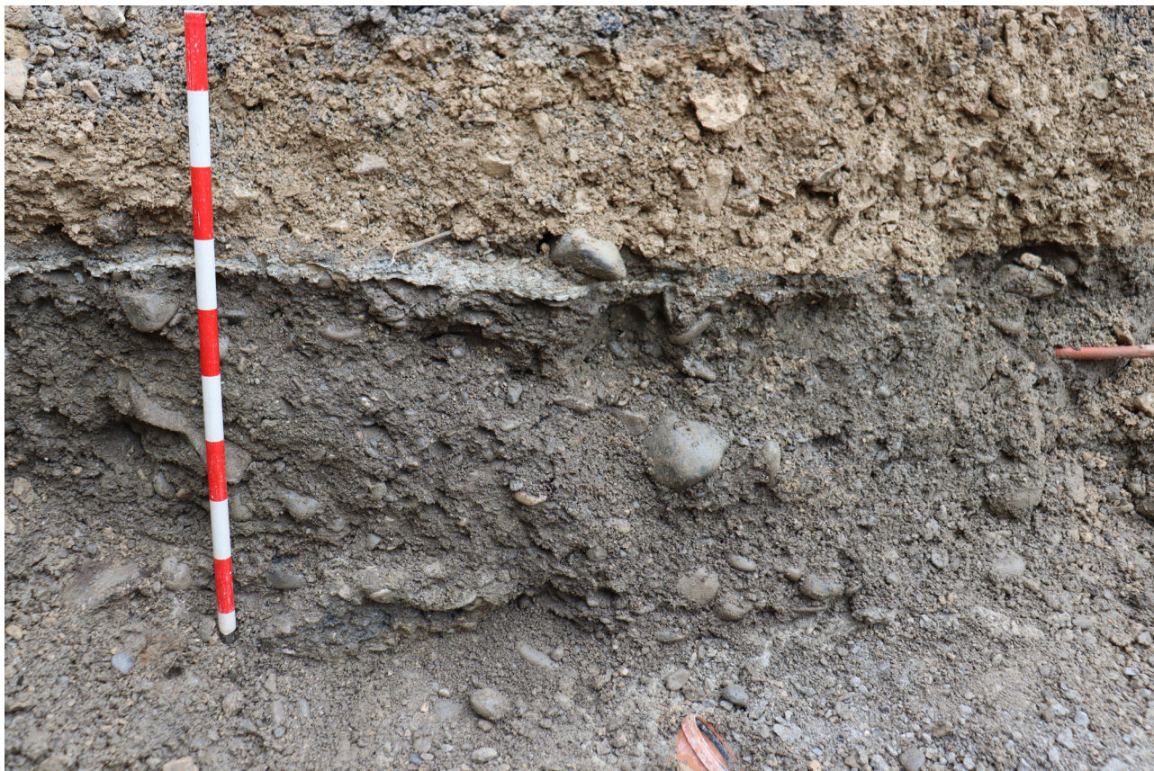
Figure 7. Colonne stratigraphique de la zone nord, vue vers le Nord-Ouest.