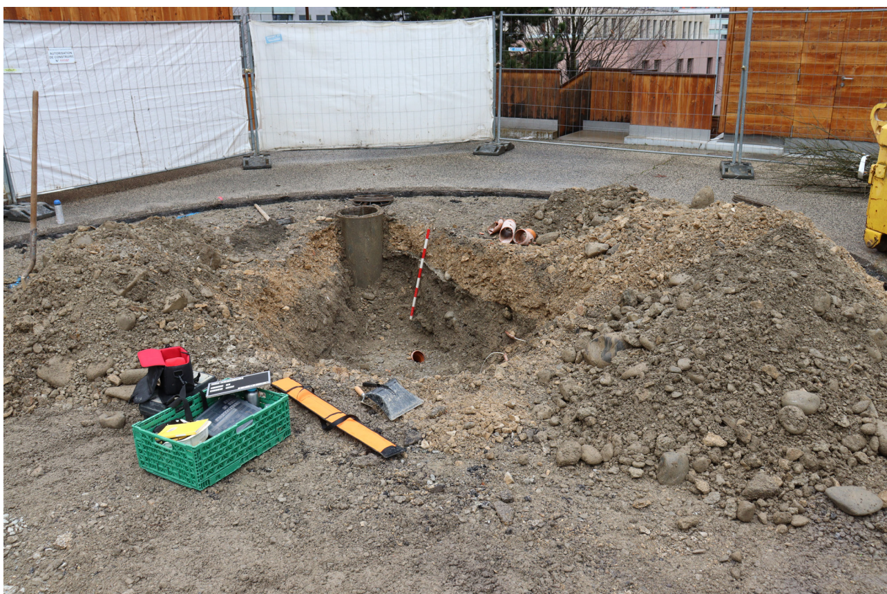
Figure 6. Nettoyage en cours dans le zone nord, vue vers l'Ouest