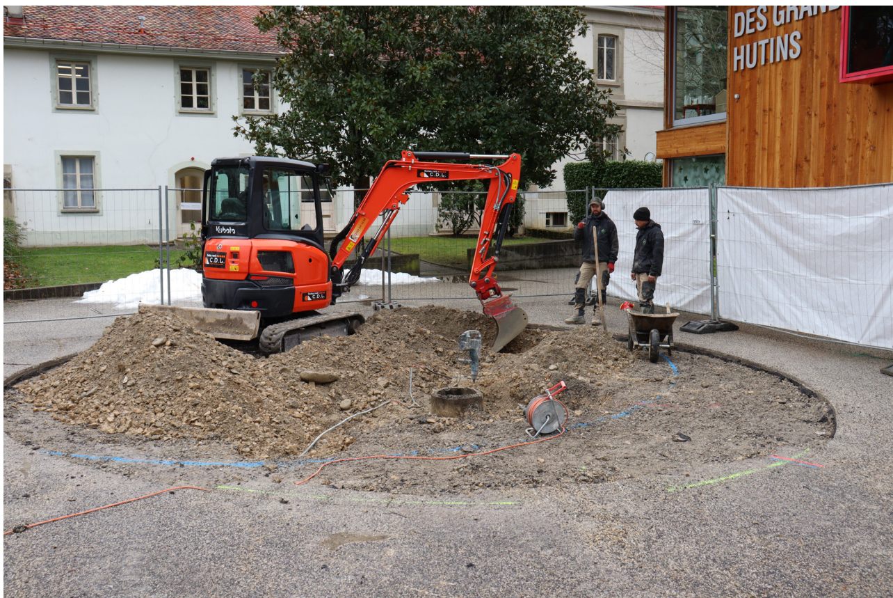
Figure 5. Photo générale de la zone sud en cours de creusement, vue vers le Sud-Ouest.