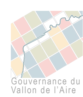
IMAGE DIRECTRICE DU VALLON DE L'AIRE