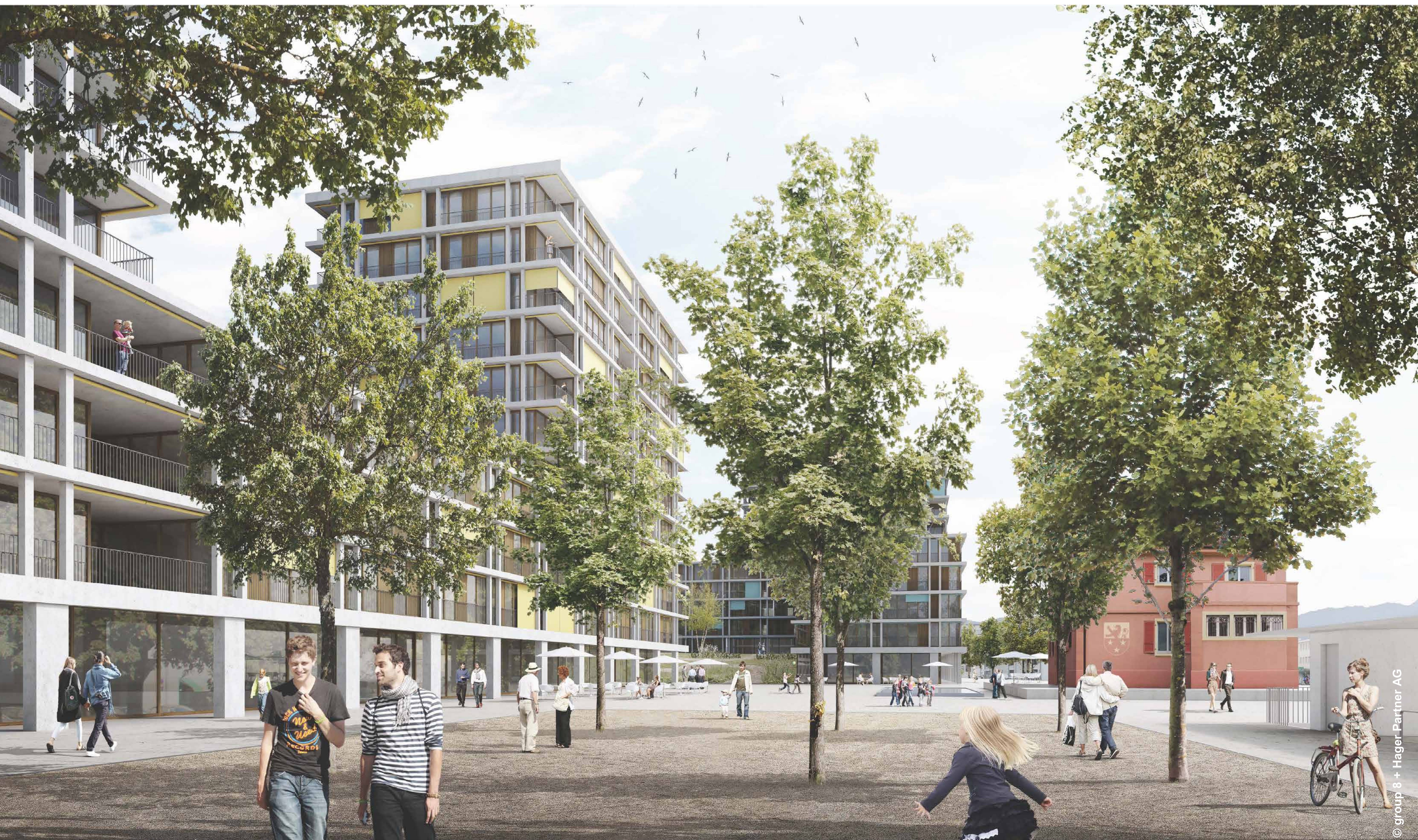
Place de Carantec

La place de Carantec renforcera son rôle de lieu public central pour la commune et accueillera la nouvelle ligne de tram. Elle est composée de la salle communale et d'une succession de lieux et d'ambiances constituant un ensemble d'espaces publics.