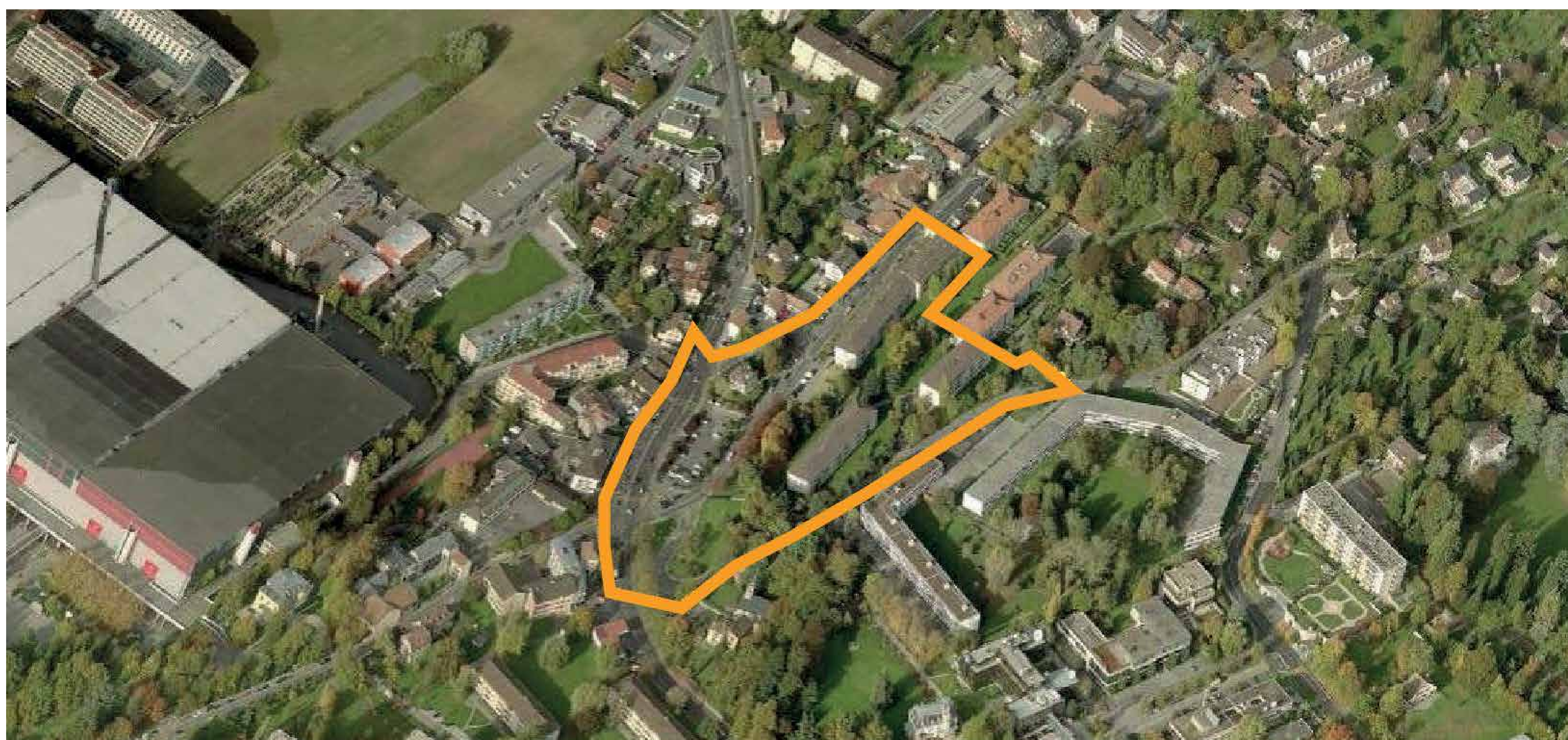
Le site du projet, vue aérienne oblique