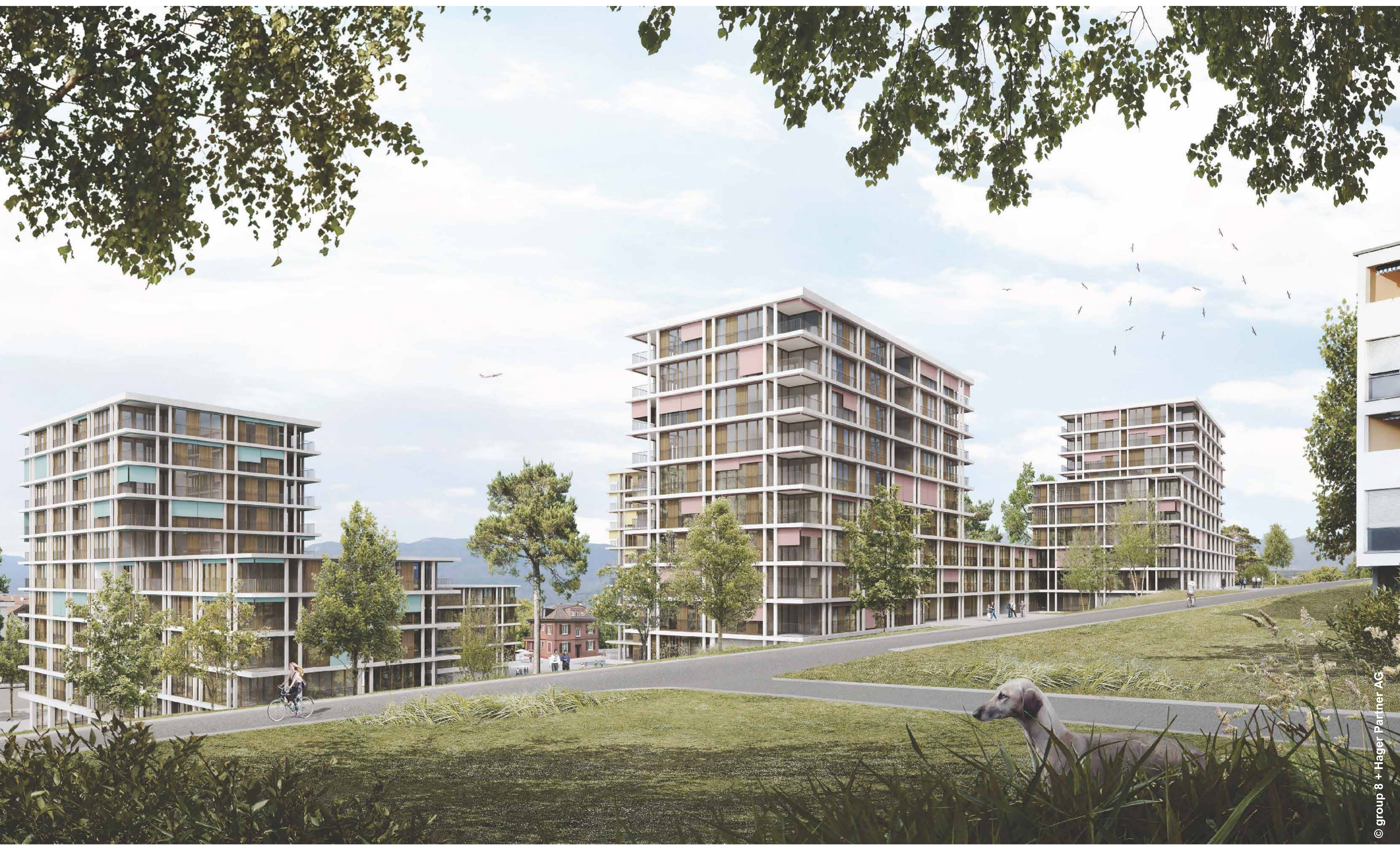
Vue depuis le chemin Auguste-Vilbert

La forme urbaine favorise les typologies de logements traversants et orientés sur deux côtés, avec des loggias aux angles des bâtiments.