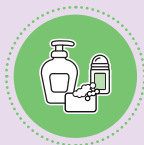
SOINS DU CORPS