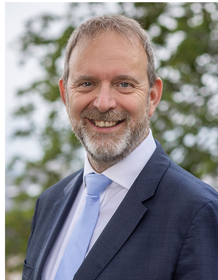
Thierry Apothéloz Conseiller d'État

La force d'une communauté se mesure à la place qu'on offre à chacune et chacun de s'accomplir pleinement.