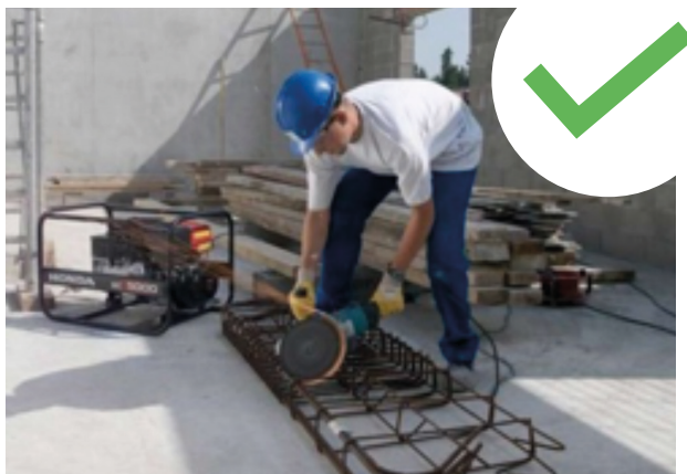
Groupe électrogène à l'extérieur.