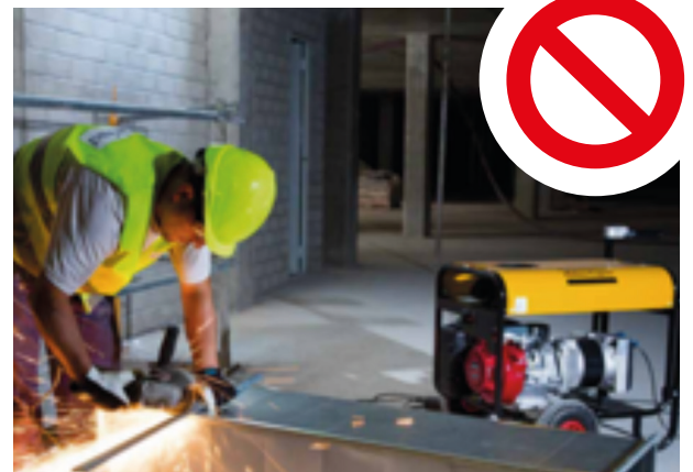
Groupe électrogène placé à l'intérieur.

Demeurent réservées les exigences en termes de protection des travailleurs qui sont de la compétence de la SUVA (division sécurité au travail).