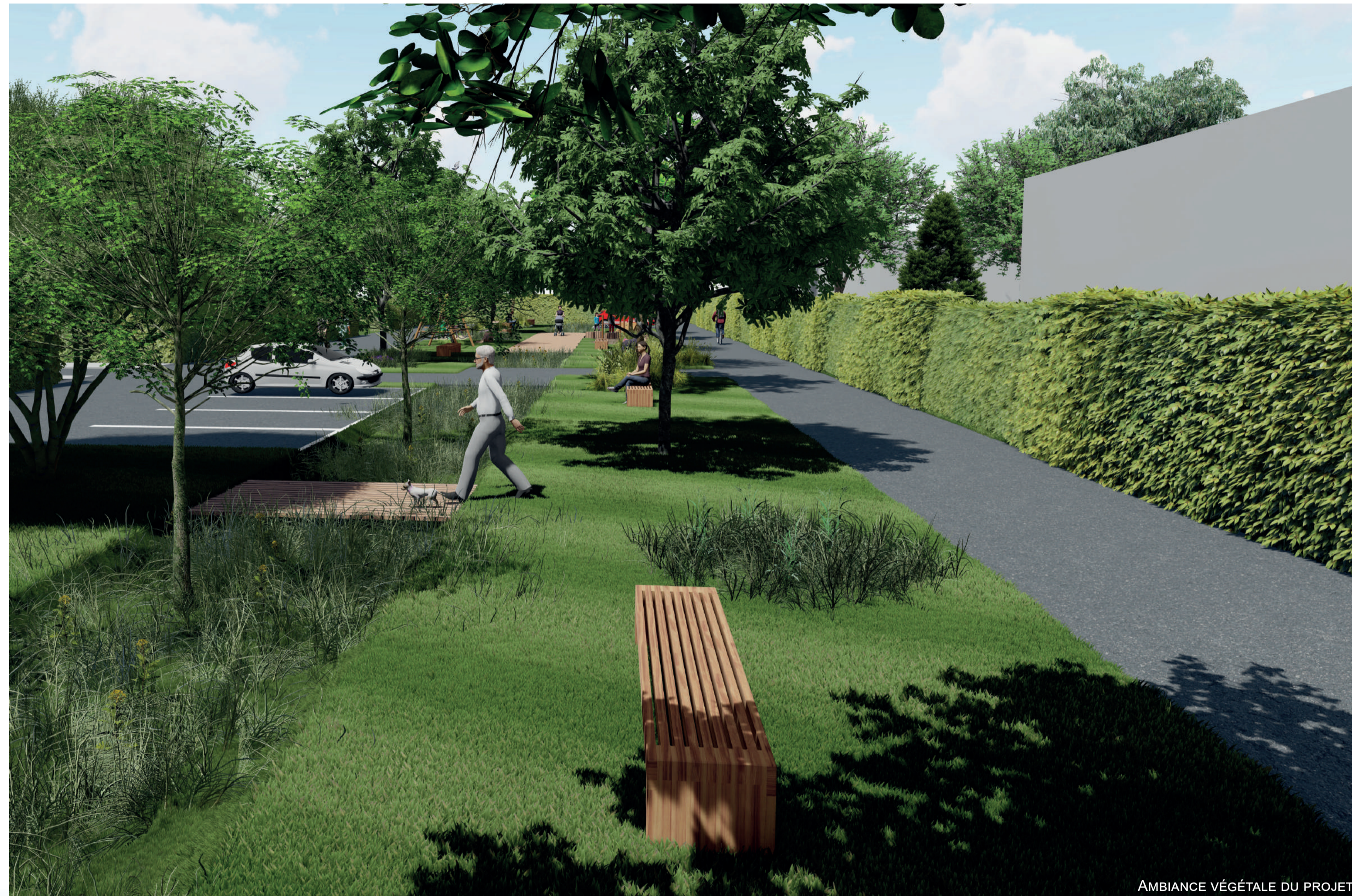
AMBIANCE VÉGÉTALE DU PROJET