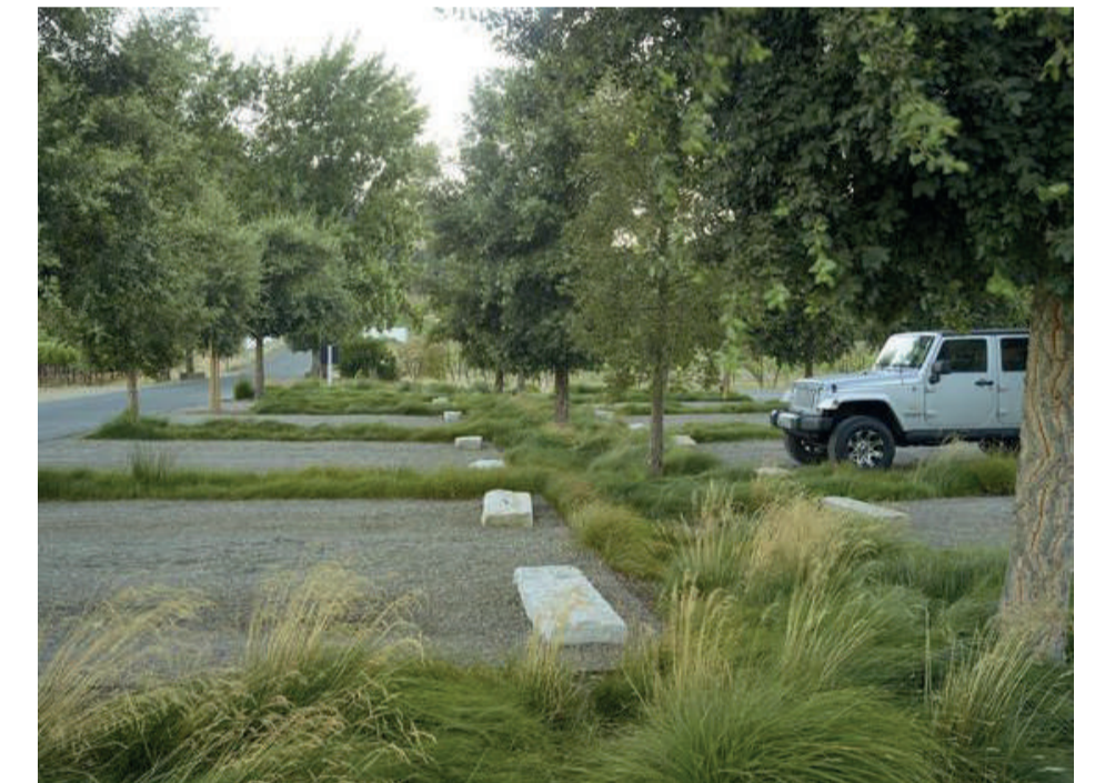
ODETTE WINERY NAPA, CALIFORNIE