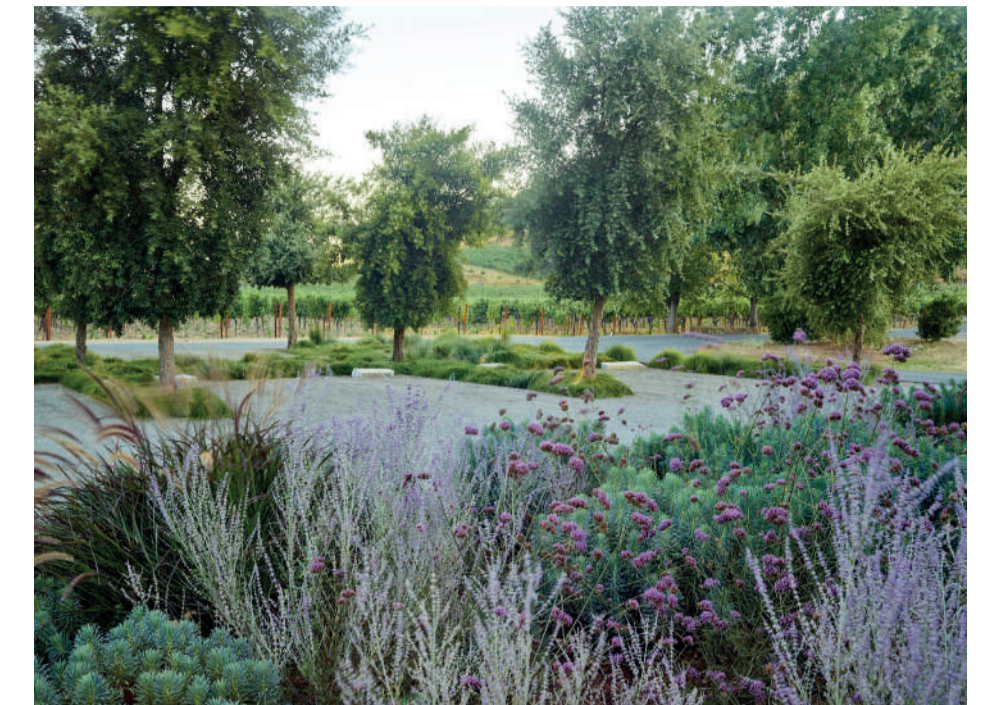
ODETTE WINERY NAPA, CALIFORNIE