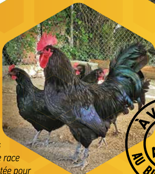
Poules noires de Janzé, une race rustique réputée pour sa capacité à chasser les frelons