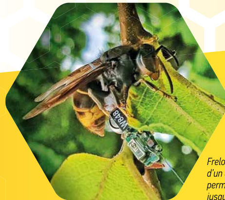
Frelon asiatique équipé d'un émetteur radio, permettant de le suivre jusqu'à son nid

Pour nourrir leurs larves, les Frelons asiatiques capturent des abeilles domestiques en grand nombre, avec pour conséquences un affaiblissement des ruches, et une baisse de la production de miel.