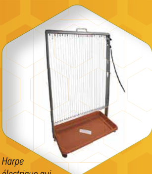
Harpe électrique qui électrocute les frelons, mais pas les abeilles