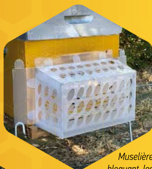
Muselière bloquant les frelons, mais pas les abeilles