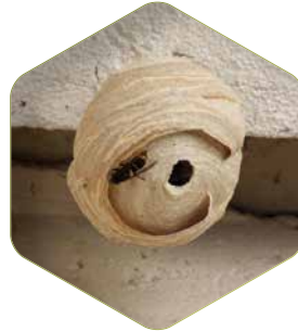
Nid de printemps (primaire)