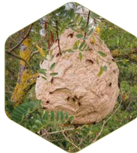
Nid d'été (secondaire)