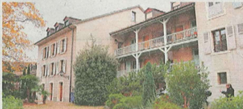
L'édile a décroché en deux jours un logement au 9, place du Marché. - JF

Onze des 13 membres du conseil, tous affiliés à des partis, siégeaient alors. La droite