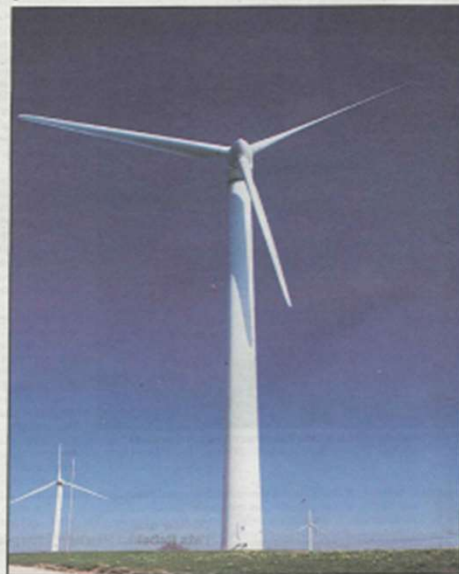
Le préposé conclut qu'il y a un intérêt du public à savoir comment les SIG ont été amenés à créer avec la maison tessinoise Rentrinvest la filiale commune Ennova, spécialisée dans la production d'énergie éolienne.

Dans sa recommandation, le préposé rejette les arguments de l'établissement autonome de droit public. Il concède uniquement qu'il serait «préjudiciable» de transmettre les documents durant l'enquête administrative portant notamment sur le partenariat éolien Juel III, estimant qu'il y a un risque que «les autorités déci-