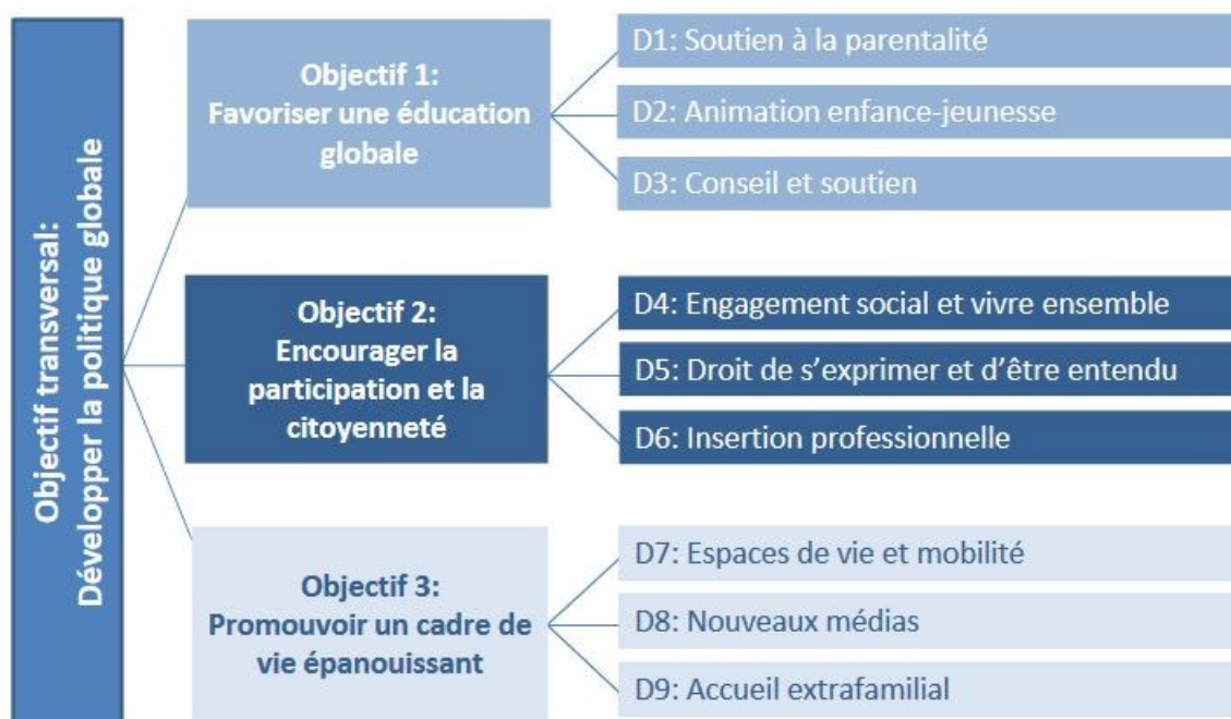
Fig. 12 Objectifs et domaines d'action prioritaires pour Fribourg

De manière générale, la stratégie du canton de Fribourg a pour objectif d'aider les décideurs/ses et les spécialistes de l'enfance et de la jeunesse à identifier les enjeux actuels, à mettre en œuvre des mesures renforçant les compétences des enfants et des jeunes et à réduire les risques et les menaces qui pourraient peser sur leur épanouissement 27 .