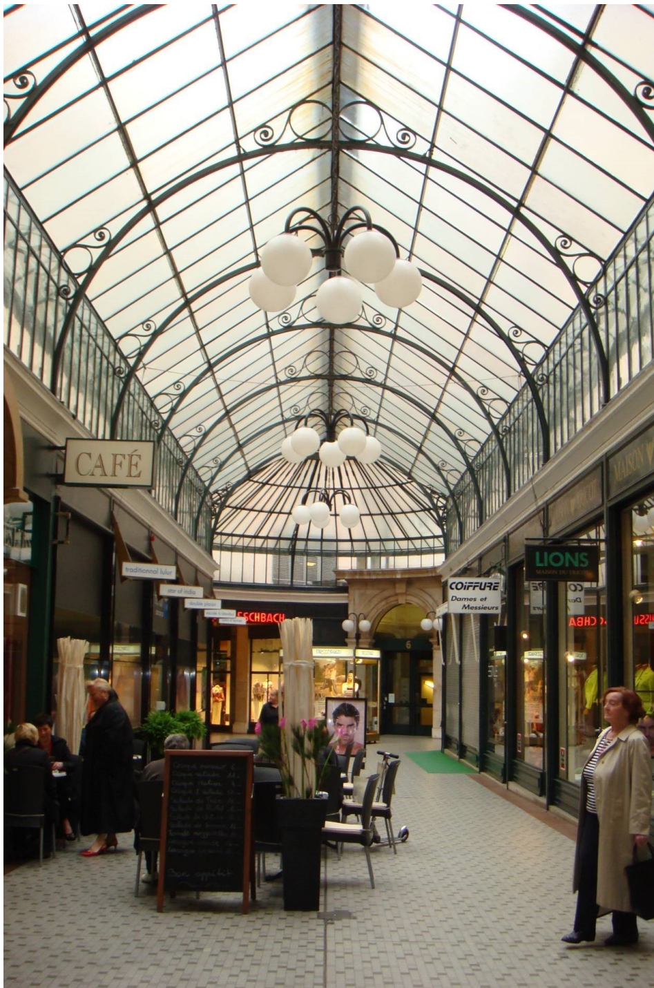
Avant travaux, © RDR architectes