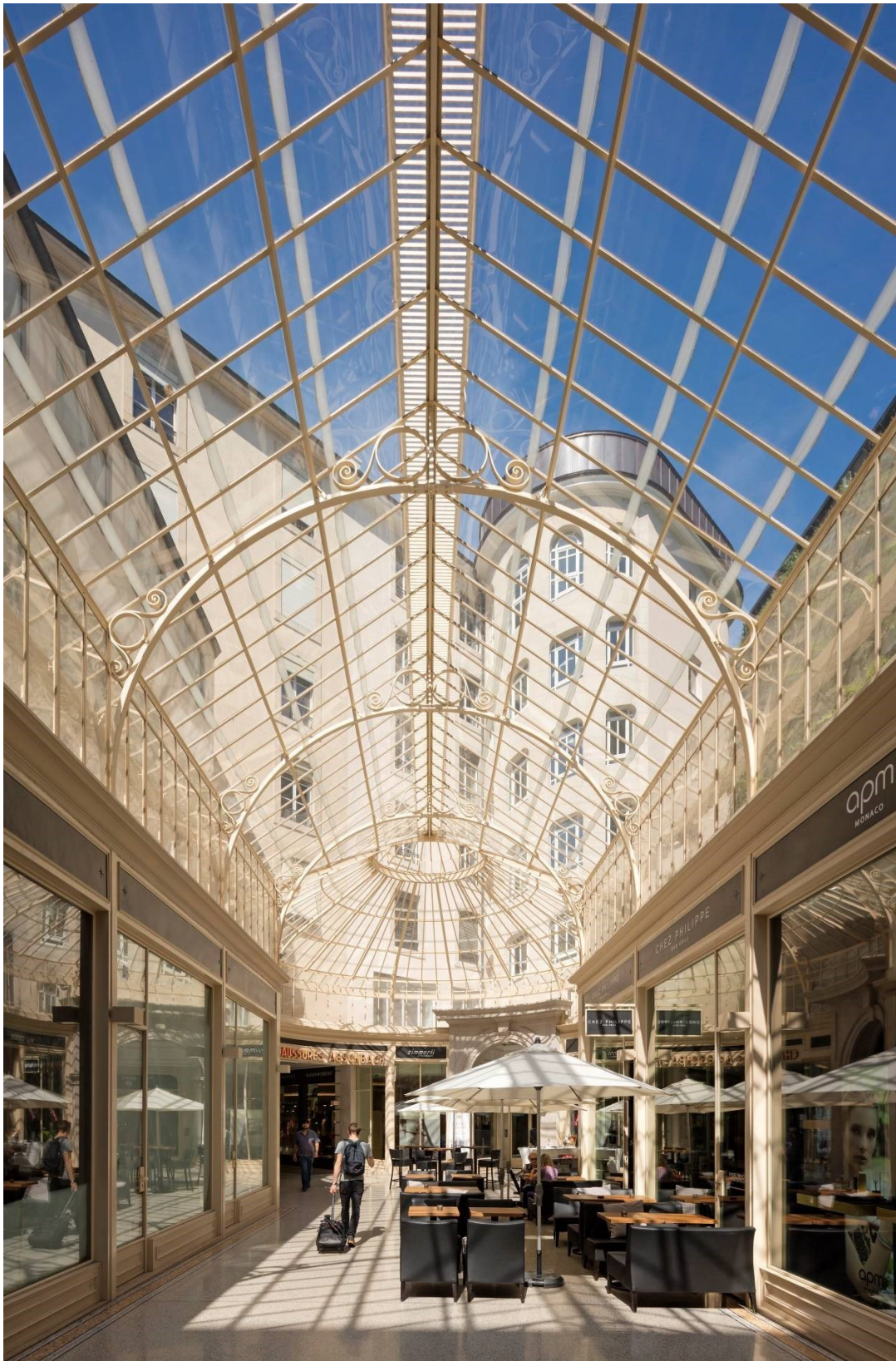
Après travaux, © RDR architectes