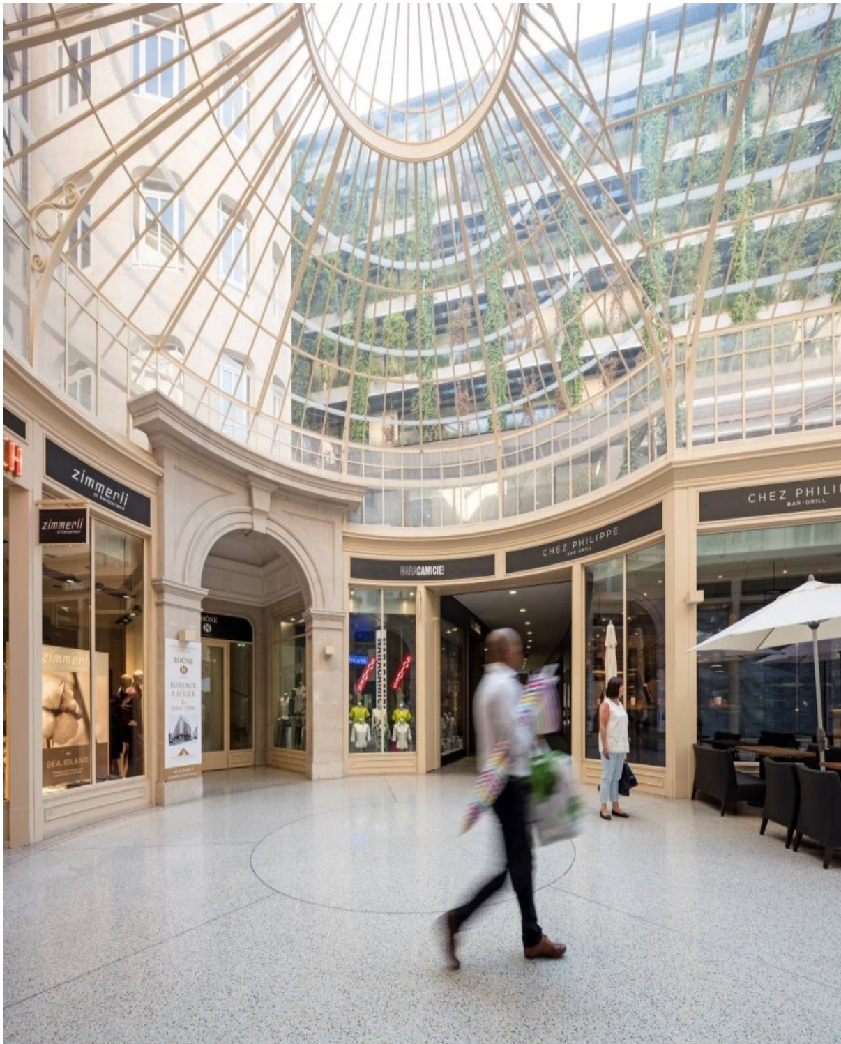
Après travaux, © RDR architectes