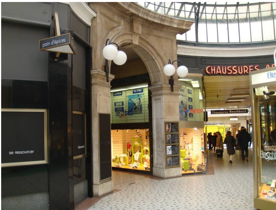
Avant travaux, © RDR architectes

Cette opération exemplaire, menée entre 2011 et 2016, et qui devrait se poursuivre avec une dernière enseigne à restaurer sur la rue du Rhône, a été subventionnée par l'État de Genève.