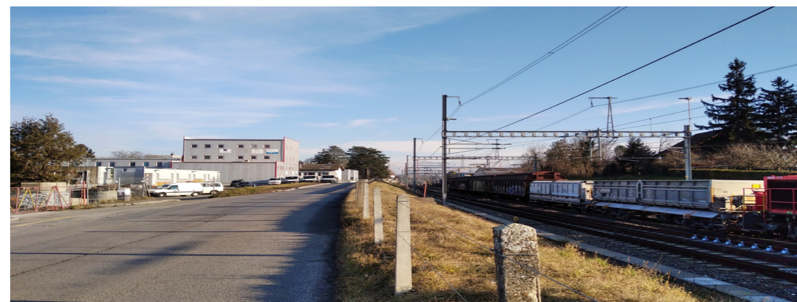
Meyrin, chemin de Champs-Prévost