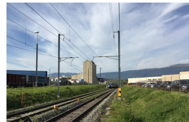
Satigny, le long des voies ferrées