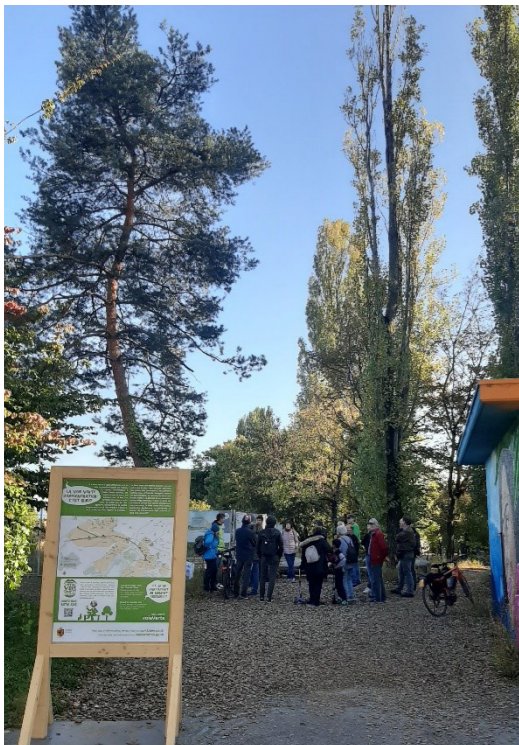
Balade guidée du 16 octobre 2021

Toutes les informations sur la démarche de concertation et l'ensemble des restitutions des différents moments de concertation sont disponibles sur concertation.ge.ch .