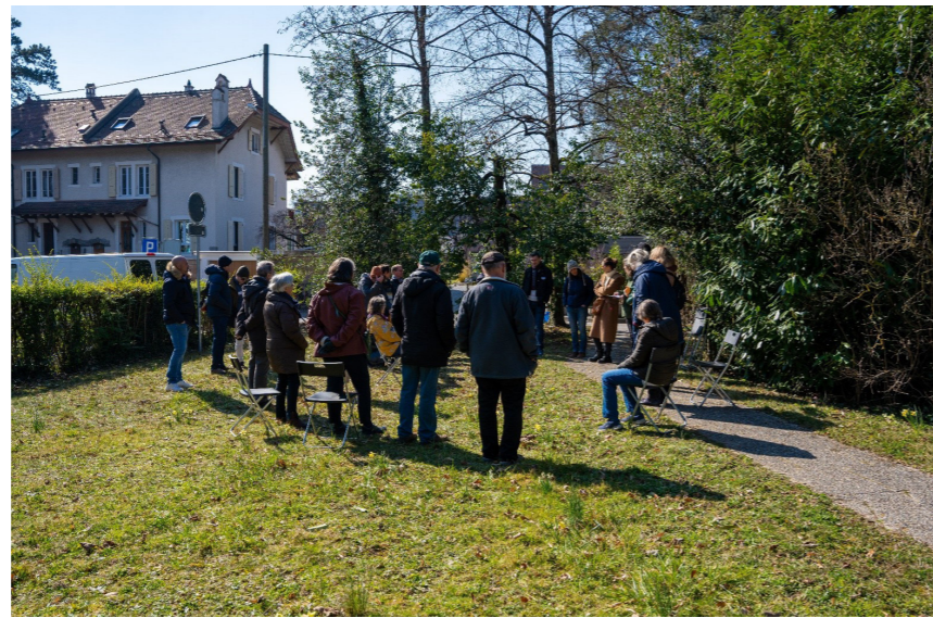
Atelier in situ sur le chemin de l'Etang du 5 mars 2022