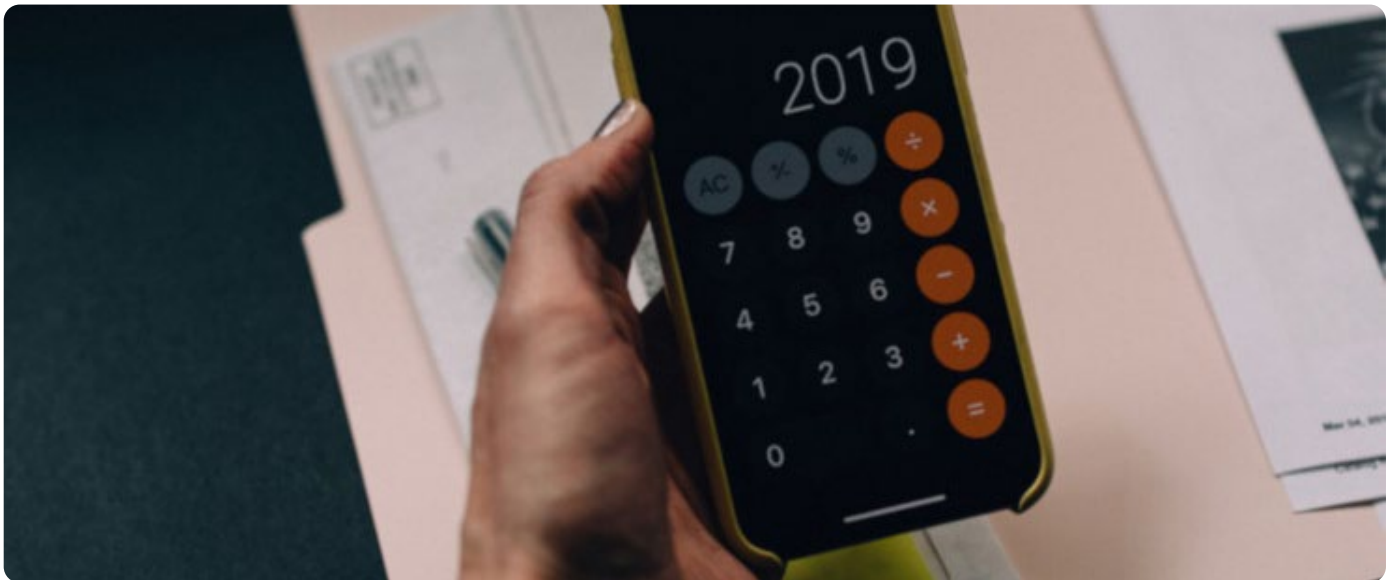
Illustration AFC / Kelly Sikkema