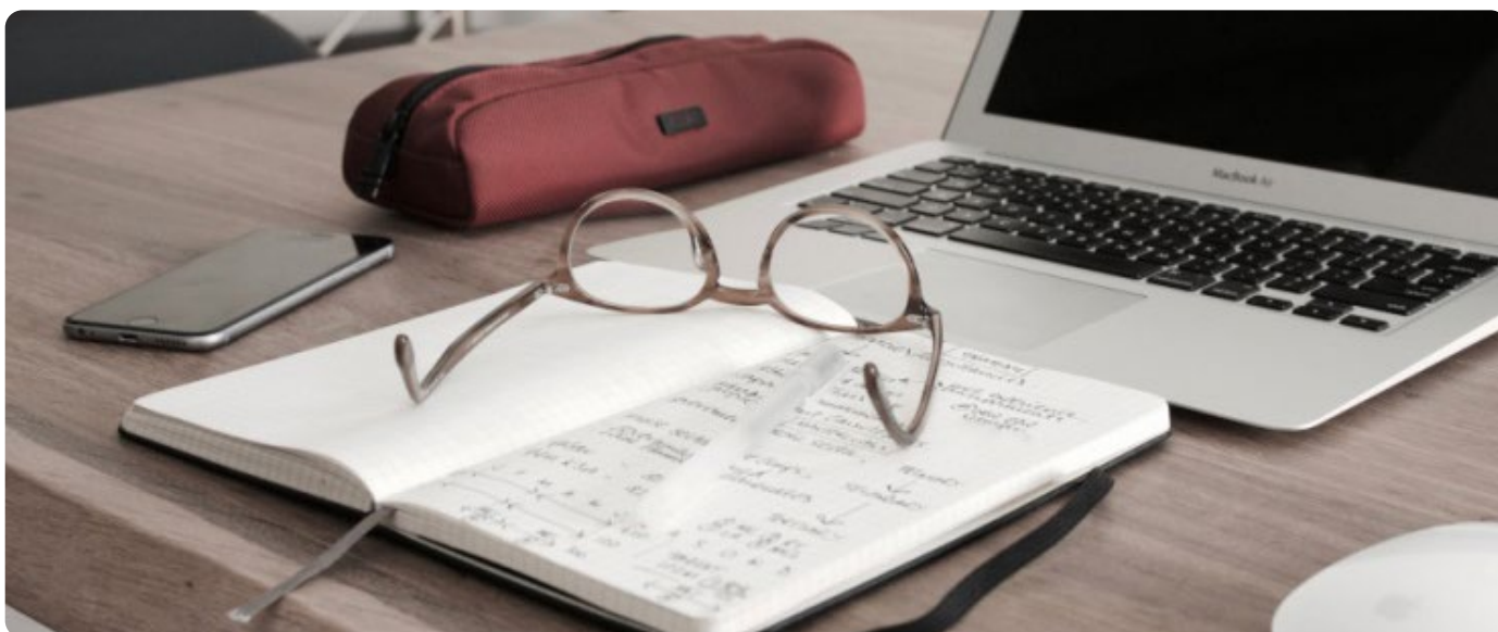
Illustration Dan Dimmock