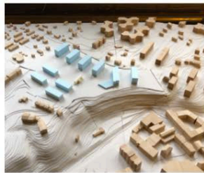
3. BARRES TAMBOURINE