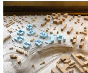
4. ÎLOTS DE VESSY