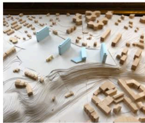
2. TOURS DE CAROUGE