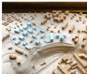
7. PLOTS CHAPELLE-FONTENETTE