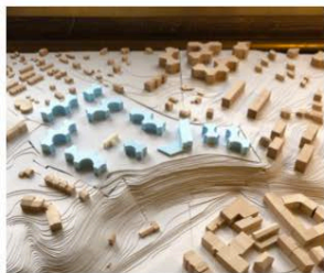
5. BÂTIMENTS DE L'UNIVERSITÉ