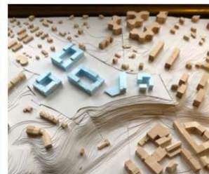
8. ÎLOTS GRANDS-ESSERTS

Ces divers rendez-vous ont servi à récolter les recommandations des habitants qui auront complété les études techniques (environnement, mobilité, etc.). Celles-ci ont été regroupées en quatre chapitres : architecture, paysage, mobilité, environnement. Tout ce matériel aura servi à élaborer l'avant-projet qui a été construit en retenant trois principes fondamentaux :