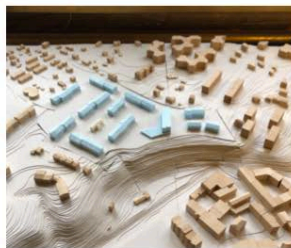
6. ENSEMBLE PINCHAT-PARC