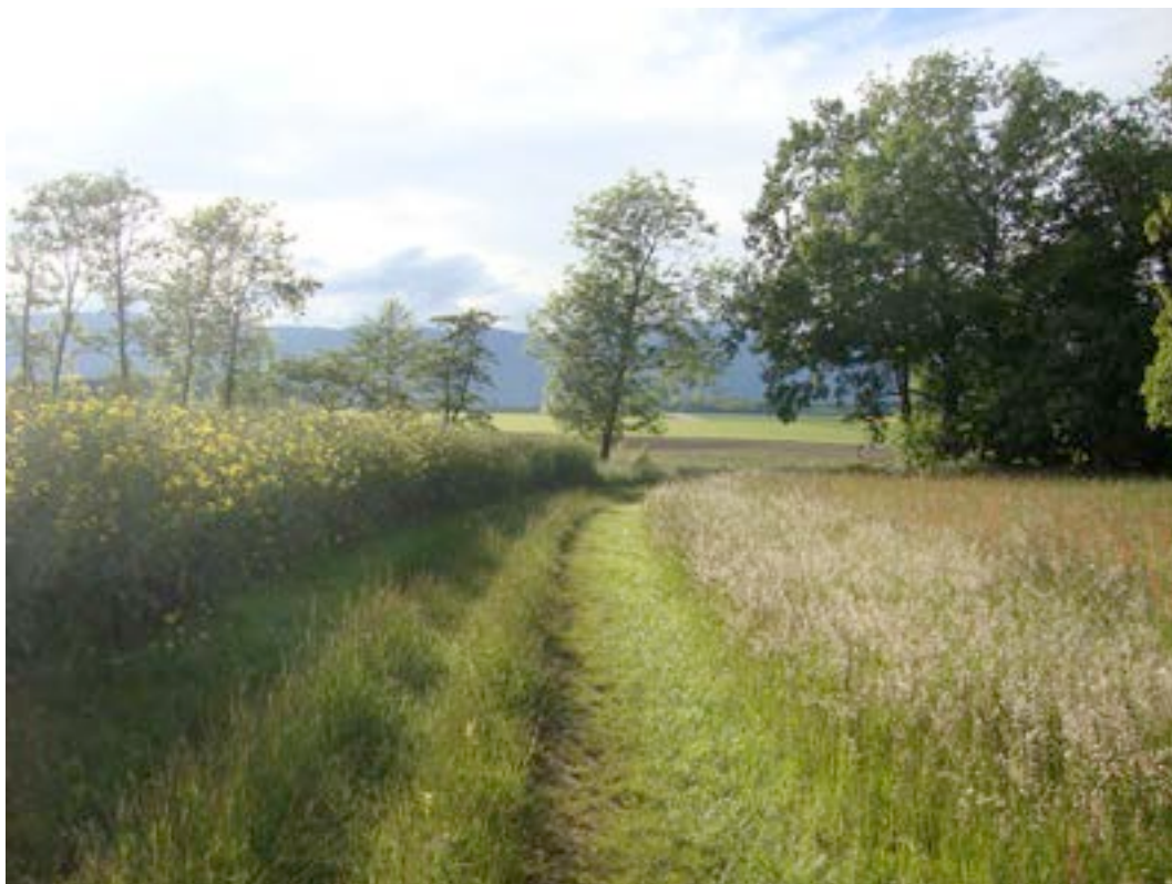
5) Réseau agro-environnemental de Céligny