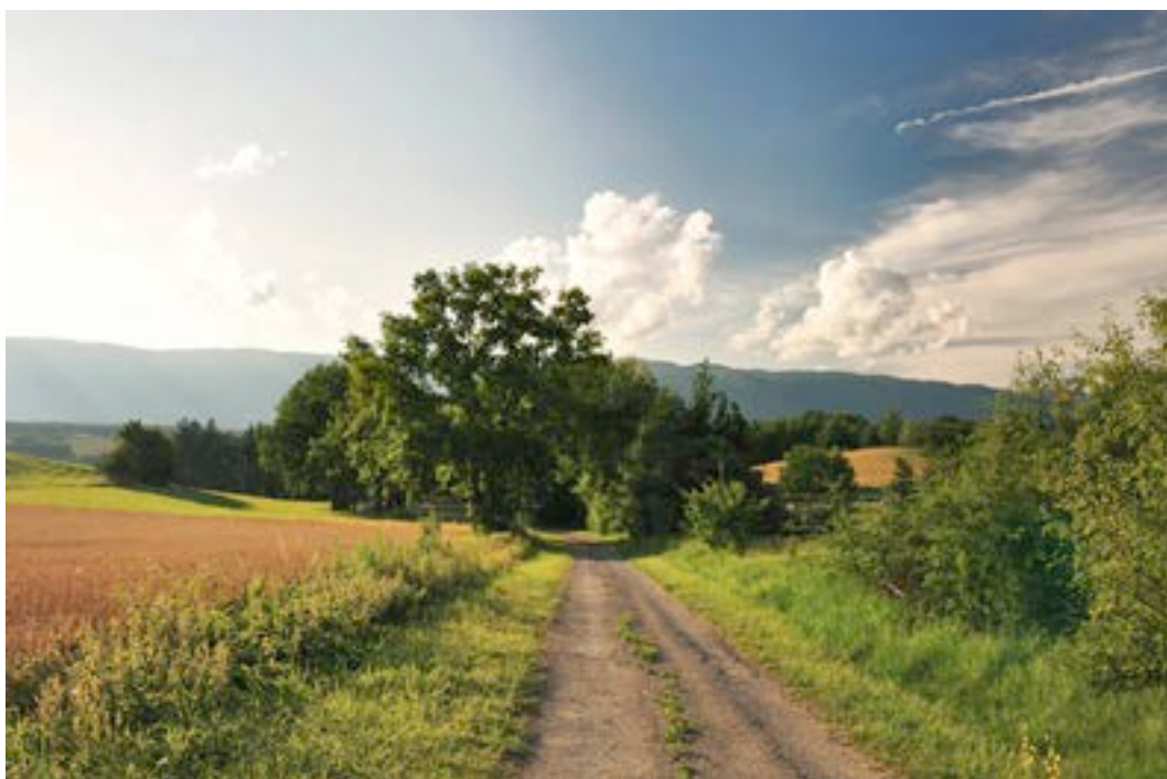
6) Réseau agro-environnemental de la Champagne genevoise près d'Avusy