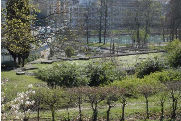
Vue des fondations de l'église romane du XII ème s.