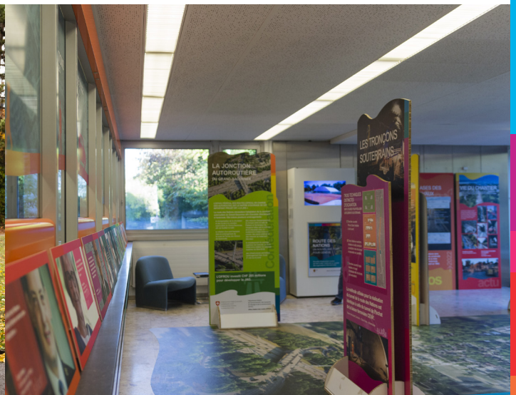
Exposition de la route des Nations / Ancienne Poste, chemin Edouard-Sarasin / Le Grand-Saconnex