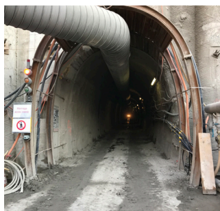
Creuse des galeries de piédroits