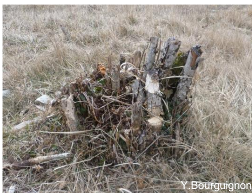
Noisetier recepé après 4 années de stabilisation

Souche encore vigoureuse avec de nombreux rejets.