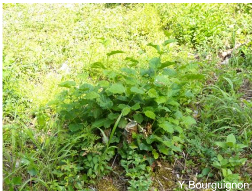
Noisetier recepé après une année de stabilisation

Pour les solidages, néophytes envahissantes très fréquentes dans les milieux perturbés, il faut intervenir en juillet et en septembre au moment du pic de floraison. La date de floraison varie entre les années et peut se retarder sous l'effet des interventions de stabilisation.