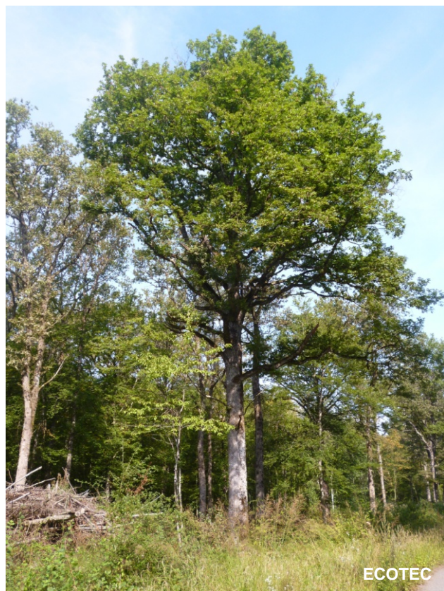
Arbre-habitat dans une lisière (Bois de Versoix, 2012)

A proximité d'infrastructures (route, sentier pédestre, etc.), éviter de maintenir un arbre-habitat qui pourrait présenter un risque pour les biens et les personnes.