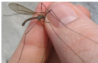
NON: ceci est une tipule ( Tipula sp. )

Ci-dessous une liste non-exhaustive d'insectes avec lesquels le Moustique-tigre pourrait être confondu: