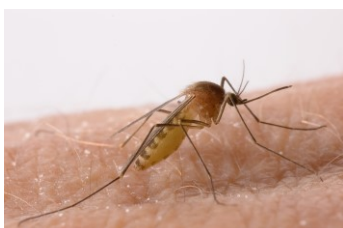
NON: ceci est un moustique très commun ( Culex pipiens )