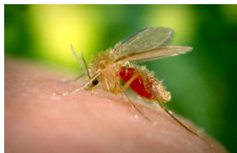
NON: ceci est un phlébotome (sous-famille des Phlebotominae)