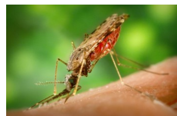
NON: ceci est un moustique indigène ( Anophele maculipennis )