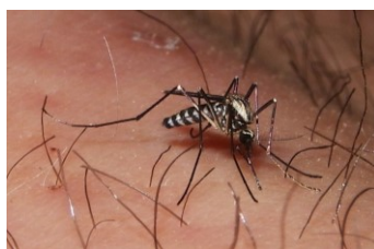
NON: ceci est un moustique indigène ( Aedes geniculatus )