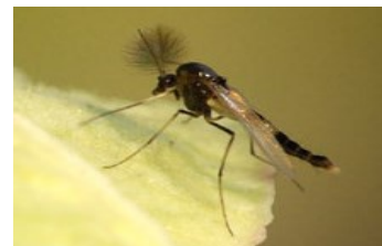
NON: ceci un chironome (famille des Chironomoidea)