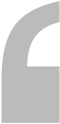
TABLE DES ACRONYMES