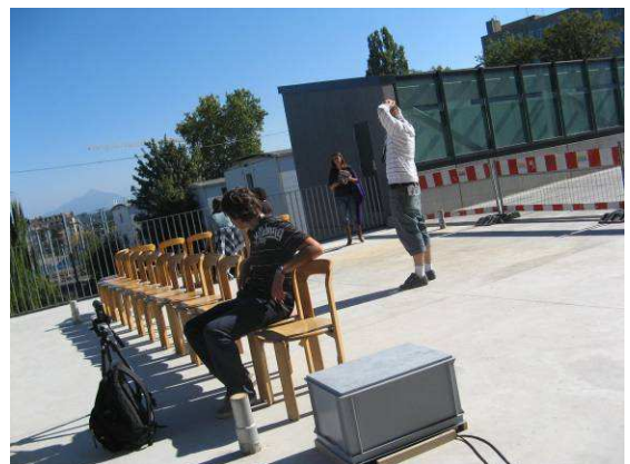
Manœuvres 2/3, octobre 2009 - Interventions au Collège Sismondi