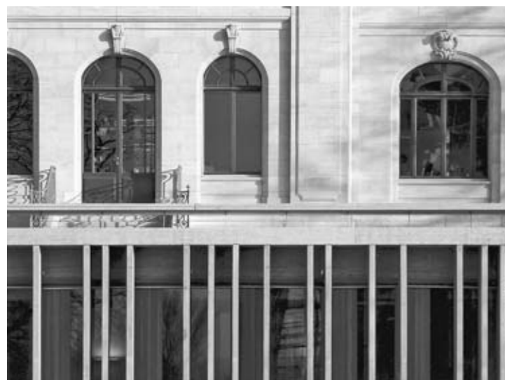
Le contraste de deux architectures qui renvoient à des réalités fonctionnelles et sociales d'époques différentes, détail de la façade nord-ouest.

Ein Beispiel dafür ist der Sitz der 1889 gegründeten Interparlamentarischen Union (IPU). Seit 1921 ist die IPU in Genf beheimatet, 2003 bezog sie das ehemalige Haus Gardiol in Grand-Saconnex. Das neoklassizistische Gebäude wurde 1906 vom Genfer Architekten Marc Camoletti, der auch das Musée d'Art et d'Histoire baute, errichtet. Auf Grund der Hanglage des Grundstücks ist seine Front nach Nordwesten gegen den Jura gerichtet. Die Ausstattung ist reich an Tapisseries, Tapeten, bunten Glasfenstern oder Dekorationsmalerei, die ein Panorama des Kunsthandwerks seiner Entstehungszeit wiedergeben. Als Boden wechseln Parkett, kolorierter Zement und Linoleum, das Teppichmuster imitiert, ab. Seit 1990 steht das Haus unter Schutz, 1999 wurde es von der Stadt Genf gekauft und der IPU angeboten. Für die Restaurierung und Erweiterung wurde im Jahr 2000 ein Wettbewerb ausgeschrieben und unter sechs Projekten dasjenige der Architekten Ueli Brauen und Doris Wälchli ausgewählt. Während das historische Gebäude nach den Vorgaben der Denkmalpflege sanft renoviert wurde, erstellte man für Konferenzräume, Bibliothek und Cafeteria eine Erweiterung im Erdgeschoss unter der alten Terrasse. Sie ist geprägt von einer Fassade aus Betonrippen, mit unterschiedlichen Abständen, die einem aleatorischen Muster folgen, das auf der Zahl Pi aufbaut. Der Kontrast der beiden Architekturen verleiht dem Gebäude eine neue Identität.