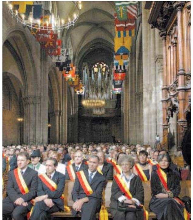
Cérémonie de prestation de serment des magistrats communaux, 23 mai 2003.

de l'exécutif qu'au Conseil municipal, mettent leurs compétences au service de la collectivité, souvent au détriment de leur vie privée et professionnelle. Ils œuvrent au quotidien, sur le terrain même, en étant proches de chacun de leurs administrés, et se préoccupent de leurs réalités quotidiennes. De l'autre, la commune vit par ses sociétés locales et les bénévoles qui les animent. C'est par eux tous qu'une collectivité se révèle, se développe et s'enrichit. Leur engagement sur le plan local est l'un des fondements de l'identité particulière qui caractérise chaque commune genevoise et contribue à la cohésion sociale de ses habitants.