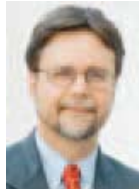
Robert Cramer Conseiller d'Etat

Pour plus d'informations http://www.geneve.ch/diae/communes/ Adresse: 7, rue des Gazomètres Case postale 36, 1211 Genève 8 Tél. 022 327 29 59