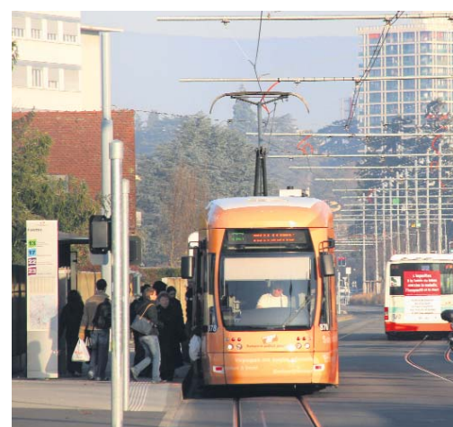
Arrêt tram Grand-Lancy.

Fidèle à son dynamisme et soucieuse d'offrir à ses habitants une cité moderne, agréable et ouverte, Lancy développe de grands projets d'avenir. A moins de 2 km du centre de Genève, entre les Ports Francs et le Stade de Genève, le site de Genève-La Praille offre un espace urbain exceptionnel. Ce sont 10 hectares qui seront bientôt aménagés en un pôle