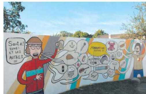
Le Monniati Festival.

et les productions de l'Echo des Champs.