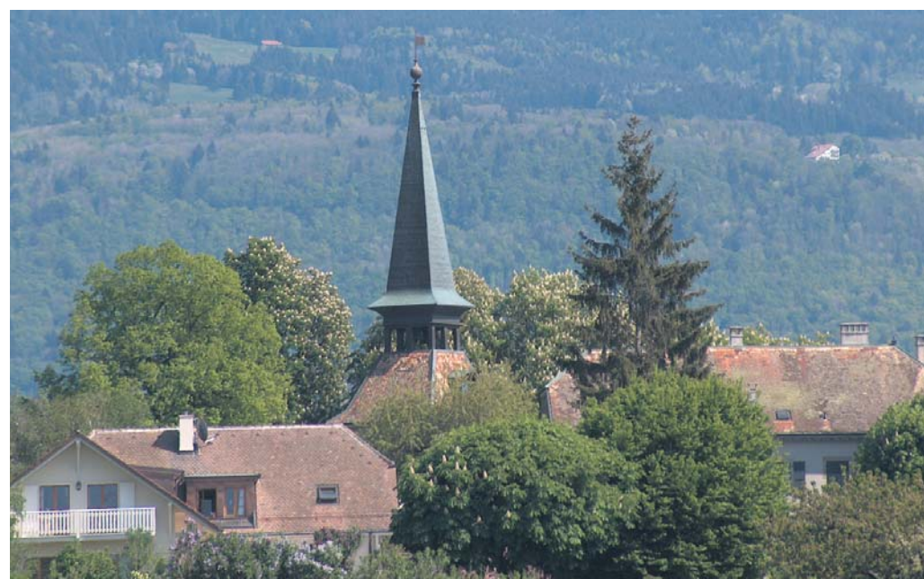
Vue de Jussy.

Le mandement de Jussy, territoire attesté comme appartenant à l'évêque de Genève dès 1227, ne comprenait au