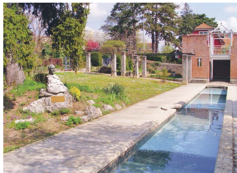
Le parc Floraire avec le buste de Henry Correvon.

Parmi les exploitations qui ont permis à Chêne-Bourg d'avoir une activité économique importante dès le siècle dernier, il faut mentionner l'une des plus originales, l'entreprise créée par Henry Correvon sous le nom de Floraire. Sous ce nom se dissimule la dernière métamorphose d'une pépinière fondée au milieu du siècle dernier à Yverdon.