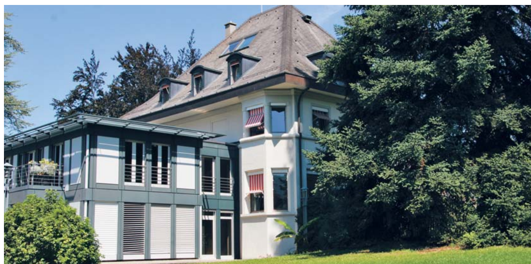
La mairie de Chêne-Bourg.

prochaine commune: Choulex le 28 septembre 2011