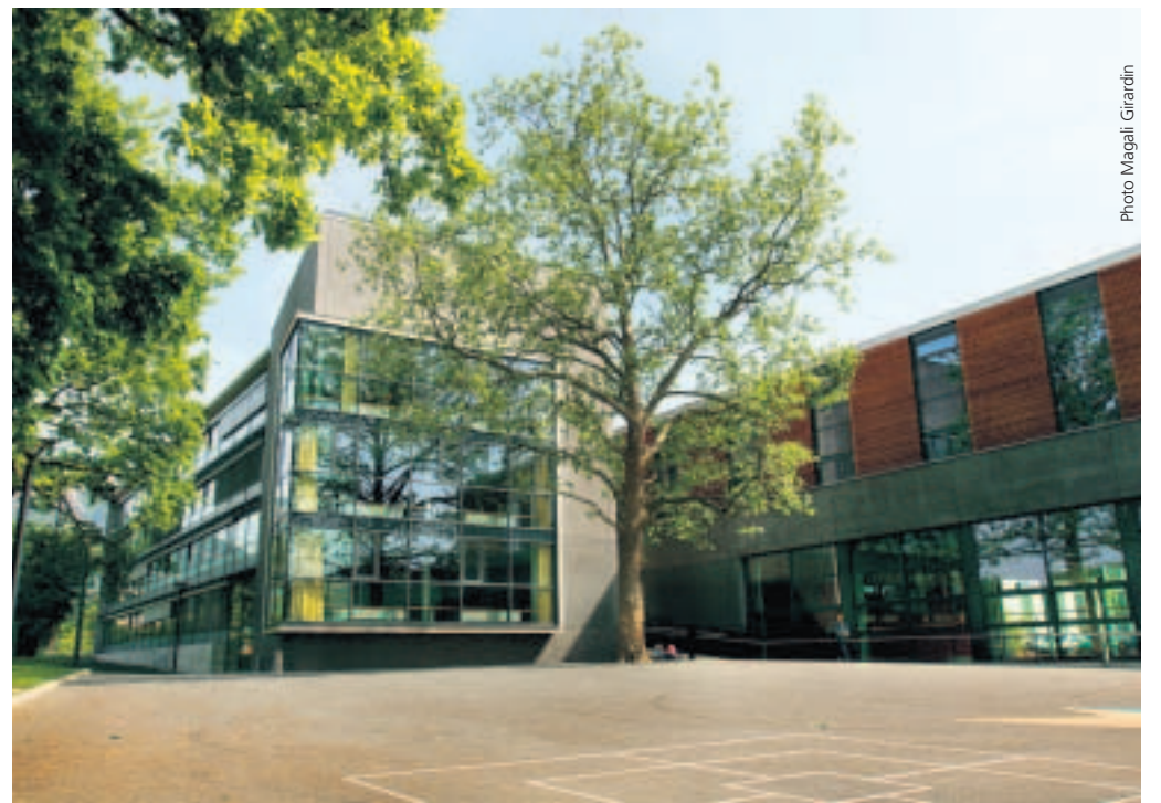
L'école de la Tambourine témoigne du développement du quartier sud de la commune.

désormais être l'un des centres de l'agglomération urbaine, avec ses nouveaux enjeux.