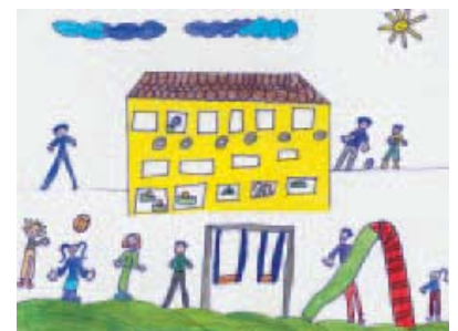
Texte et dessin réalisés par les enfants de l'école d'Aire-la-Ville

Nous participons de cette manière à la construction de notre école. Nous espérons donc qu'elle continuera ainsi, car c'est notre deuxième «paradis».