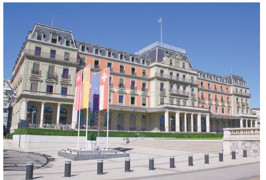
Siège du HCDH, le Palais Wilson, ainsi nommé en hommage au président américain T. Woodrow Wilson, a notamment accueilli le secrétariat général de la Société des Nations entre 1920 et 1936.

L'ensemble de ces activités est placé sous la responsabilité du Haut-Commissaire aux droits de l'homme. Depuis le 1 er septembre 2008, c'est la sud-africaine Navanethem Pillay qui assume cette fonction. Mme Pillay a succédé à Louise Arbour, et, avant elle, à Sergio Vieira de Mello, dont la mémoire est chère à Genève. M. de Mello avait en effet tissé des liens personnels avec notre canton, et c'est au cimetière des Rois qu'il repose suite à son tragique décès dû à un attentat en Irak en 2003, où il assumait la fonction de représentant spécial du secrétaire général de l'ONU. La République et canton de Genève lui a par ailleurs conféré la bourgeoisie d'honneur à titre posthume. C'est également à Genève que sa famille et