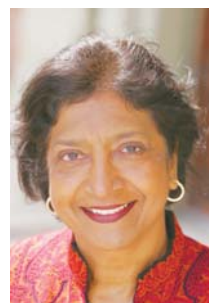
Mme Navanethem Pillay, Haut-Commissaire aux droits de l'homme.

Quel est l'avantage pour votre organisation d'avoir son siège à Genève?