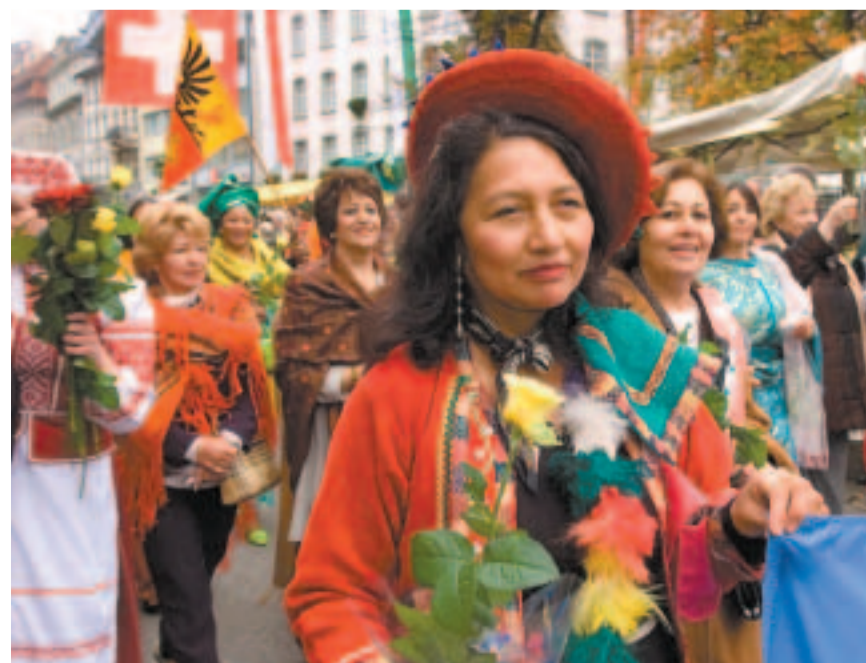
En costumes de tous les continents, les dames du Cercle féminin des Nations Unies, ambassadrices de la paix dans le monde, ont offert des roses au public pendant le cortège.

Retrouvez notre reportage-photos sur le site Internet officiel à l'adresse: www.geneve.ch/fao/2005/20051026.asp