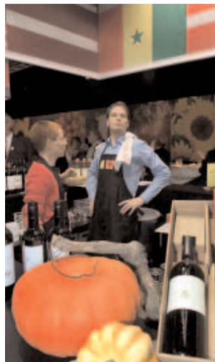
Le stand genevois à l'OLMA 2005.