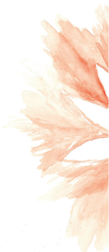
Illustration de couverture: Khadra / 08