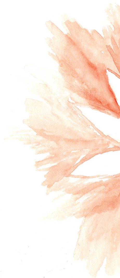
Illustration de couverture : Khadra / 08