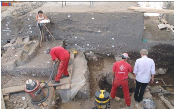
Figure 9. Fouilles archéologiques en cours dans le sondage de l'Esplanade de Saint-Antoine