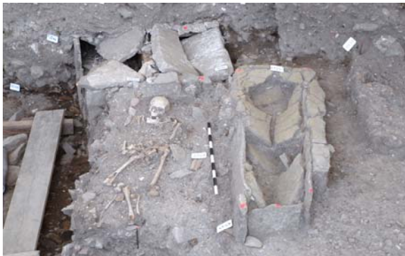
Figure 7. Tombes en dalles et inhumations en pleine terre du cimetière de Saint-Laurent