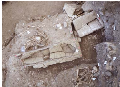
Figure 6. Ensemble d'inhumations du cimetière de Saint-Laurent