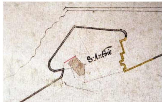
Bastion de Saint-Antoine (forme d'as de pique) avec le mottet de Saint-Laurent en surface et surélevé (en rouge, le tronçon de mur découvert lors d'un sondage du SCA)