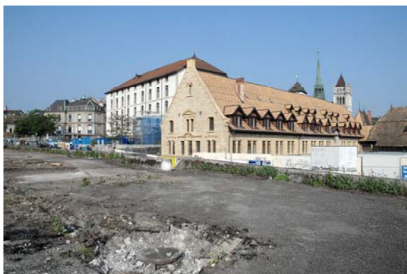
Figure 1. Réaménagement de l'Esplanade de Saint-Antoine, début des investigations archéologiques, juin 2012