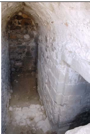
Figure 3. Intérieur de la casemate, voûtée en berceau, avec ses poternes et sa meurtrière en blocs de molasse