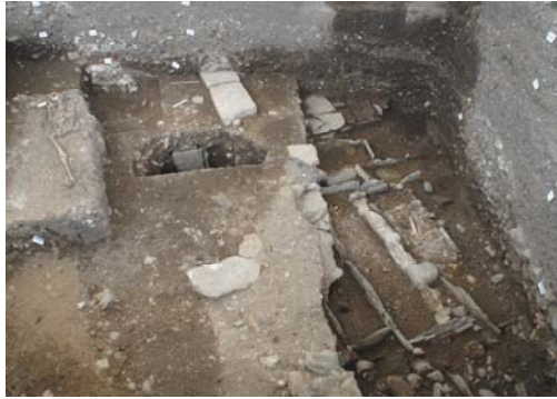
Figure 5. Sondage archéologique, tombes en dalles appartenant probablement à la chapelle Saint-Laurent