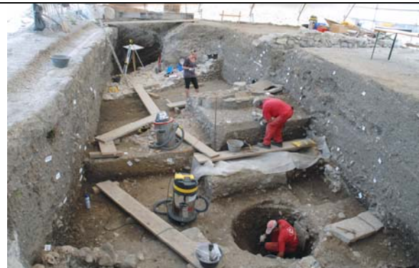
Figure 10. Fouilles archéologiques en cours dans le sondage de l'Esplanade de Saint-Antoine