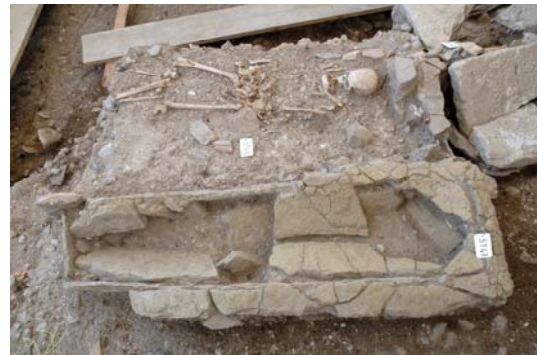
Figure 8. Tombe en dalle et inhumation en pleine terre du cimetière de Saint-Laurent