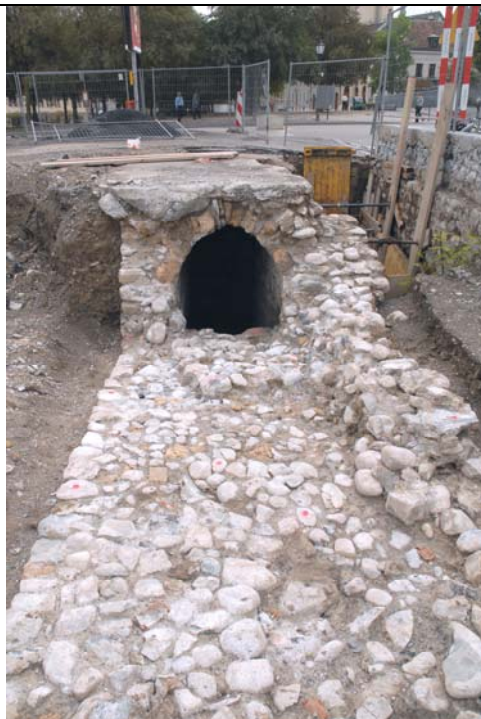
Figure 2. Casemate du bastion de Saint-Antoine (1559-1560) remise au jour au sud-ouest de l'Esplanade