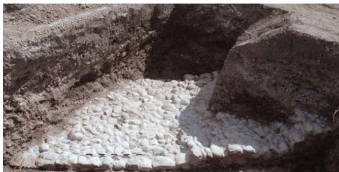
Figure 4. Mottet de Saint-Laurent construit en 1537